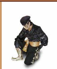
2000.1.5 Start NEW Dio

海外進出を目標に従来のDioのショーに中国語バージョン、英語バージョンを追加。言葉の変換だけではなく、その国の持った感覚に合うように全体的にアレンジが加えられている。