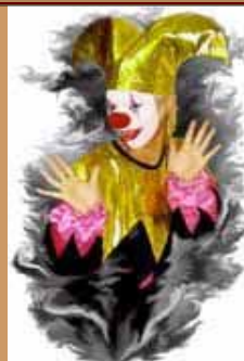
Clown character JOKER

国際的に活動するエンターテインメント興行(本部:アメリカ)、インターナショナル・トップ・エンターティナー・ツアー'97の日本代表として選ばれる。これは「Dio」の独創的なパフォーマンスが国際的に認められた瞬間といえるだろう。この年に多数の賞を受賞